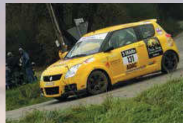
Montino - Rossato