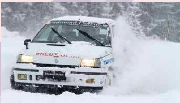
La parte pratica del corso di guida su neve e ghiaccio