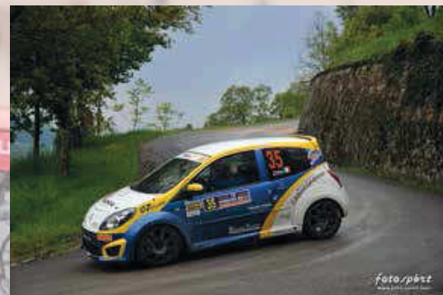
Zille - Meneano