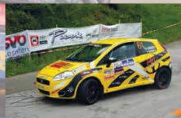
Boscariol - Zanchetta