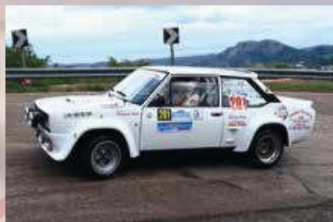
Lai - Musu