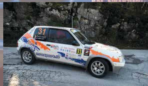
Di Majo - Pascolo