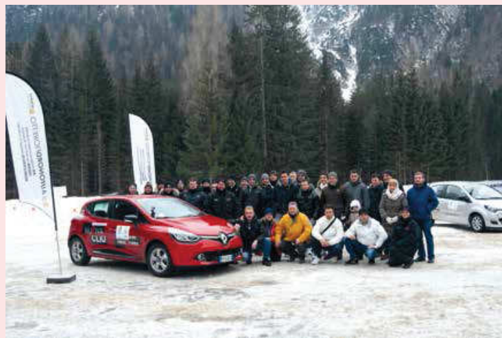
I partecipanti al primo corso di guida su neve e ghiaccio, tenutosi ad Auronzo nel 2012

E' in cantiere l'organizzazione di un corso di pilotaggio Rally che dovrebbe articolarsi in lezioni teoriche e pratiche con l'obiettivo di fornire a tutti gli iscritti le basi "tecniche" per poter partecipare ad una competizione