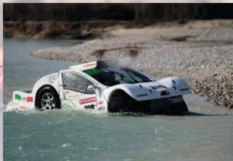
Toro - Nadin