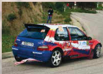
Donisi - Cottu