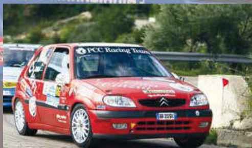
Contini - Zara