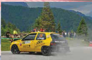
Reputin - Artico