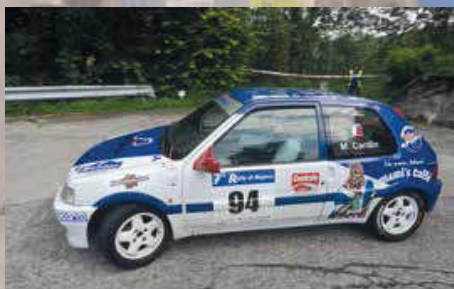
Cardin - Rossato